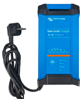
Blue Smart IP22 12/30 (3)