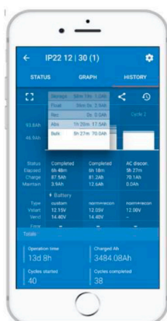
Uma das telas de histórico