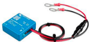
Smart Battery Sense Permite o carregamento com compensação de temperatura e tensão.