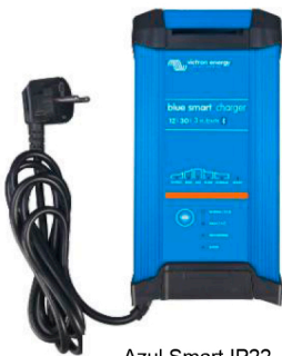
Azul Smart IP22 30/12 (3)