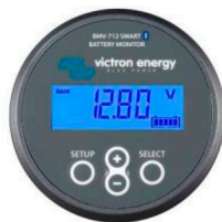
Monitor de bateria inteligente BMV-712