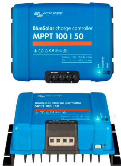
Controlador de carga solar MPPT 100/50