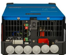
MultiPlus 2000 VA (sem tampa inferior)