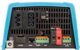
Multi Plus 500/800/1200/1600VA