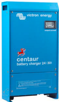
Centaur Battery Charger 24 30